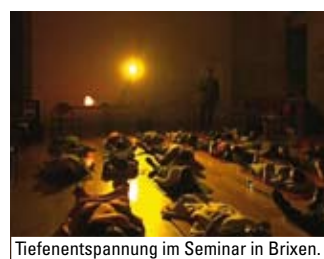
Tiefenentspannung im Seminar in Brixen.

logischer Behandlung sind oder waren. Mentalmethoden können zwar im Normalfall ungefährlich sein, aber jede Art von Entspannungstechnik kann für Menschen mit Depressionen, Psychosen oder Schizophrenie grundsätzlich auch mal eine Schädlichkeit beinhalten. Darum muss jeder Teilnehmer unseres Seminars vorab einen Gesundheitsbogen ausfüllen. Und Raucher, die in psychologischer Behandlung waren, dürfen nur dann am Seminar teilnehmen, wenn ihr behandelnder Arzt damit einverstanden ist. Andernfalls bekommen sie im Kurs ihr Geld zurück, und müssen leider gehen.