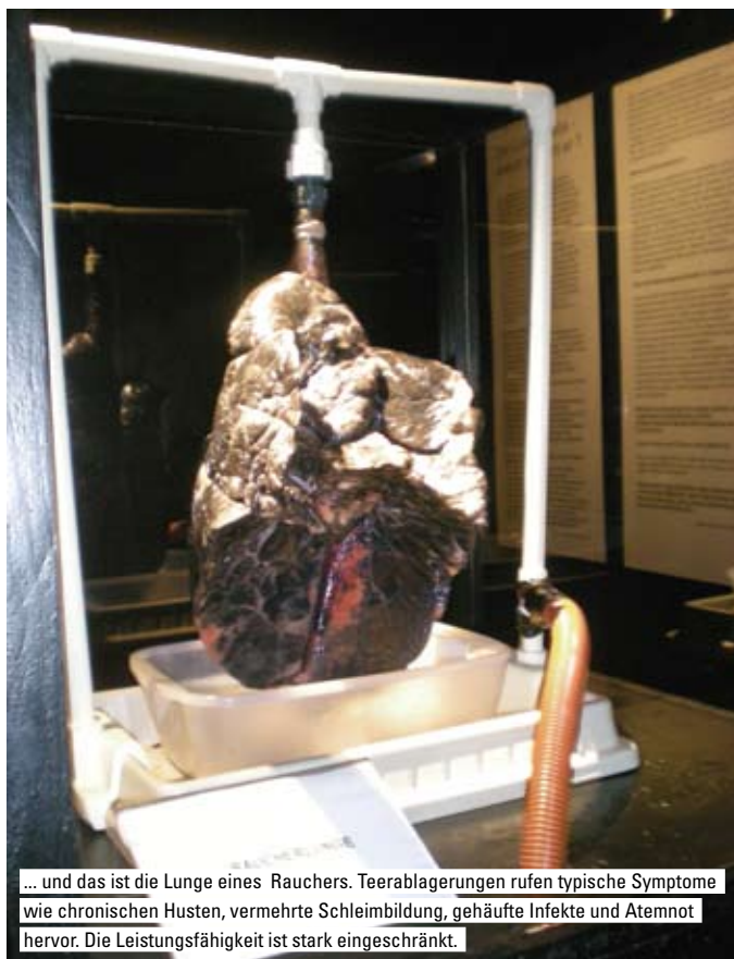
... und das ist die Lunge eines Rauchers. Teerablagungen rufen typische Symptome wie chronischen Husten, vermehrte Schleimbildung, gehäufte Infekte und Atemnot hervor. Die Leistungsfähigkeit ist stark eingeschränkt.